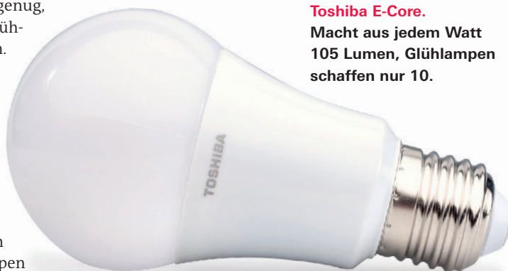
Toshiba E-Core. Macht aus jedem Watt 105 Lumen, Glühlampen schaffen nur 10.

Glühbirnen strahlen das Licht rundum ab, LED leuchten oft gerichteter. Die Stiftung Warentest bestimmt den „Halbwertswinkel“: Das ist der Bereich, in dem Lampen min-