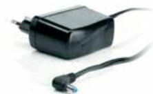
1x Energy saving switched mode power supply