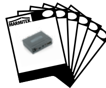
1x Quick installation manual English, Deutsch, Francais, Espanol, Italiano, Nederlands.