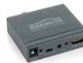
1x HDMI audio extractor